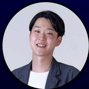
株式会社LODU 代表取締役

海外での自動車リサイクル事業に従事。2018年から7年間にわたり、SDGs推進を目的とした「KAIHO 2030プロジェクト」の推進を担う。