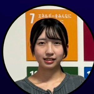
金沢工業大学 バイオ・化学部 環境・応用化学科 3年

野々市市の小学生から大学生が中心となって活動する、若者のまちづくり組織「野々市市SDGs推進協議会」の運営メンバーとして活動。