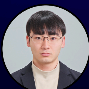
金沢工業大学 バイオ・化学部 環境・応用化学科 1年