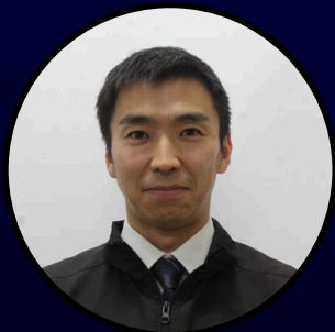
会宝産業株式会社 執行役員