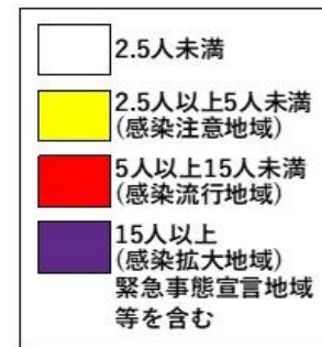
直近1週間の人口10万人あたりの新規感染者数