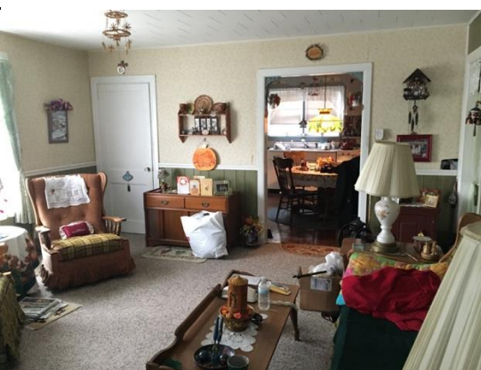
図4 サンクスギビングに彩られた友人の祖母の家