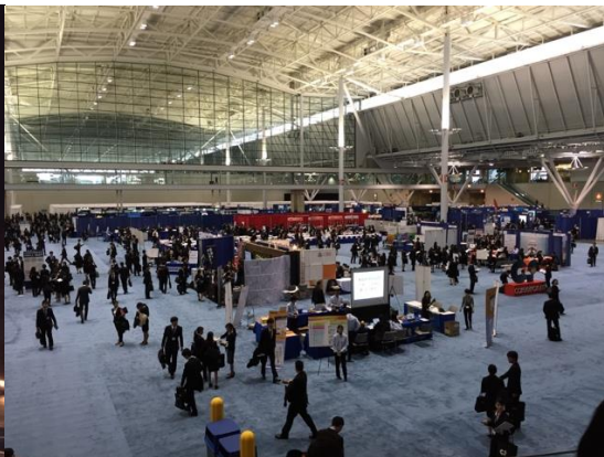
図2 ボストンキャリアフォーラム当日