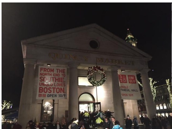
図3 ボストンでの観光

その後、ボストン観光を経てニューヨークへ向かいました。しかし、そこで風邪をひいてしまい、4日ほど寝込んでしまいました。一度ニューヨークには行ったので良かったのですが、観光をするには少しもったいなく感じます。ニューヨーク後はニュージャージーの友人の祖母の家でお世話になりました。病み上がりで何も食べられませんでした。ターキーを食べる文化や、たくさんの飾り付けがされた家を見て文化に触れる事が出来たと思います。