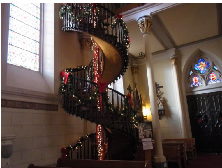
聖ヨゼフの階段 サンタフェ ロレットチャペルにて