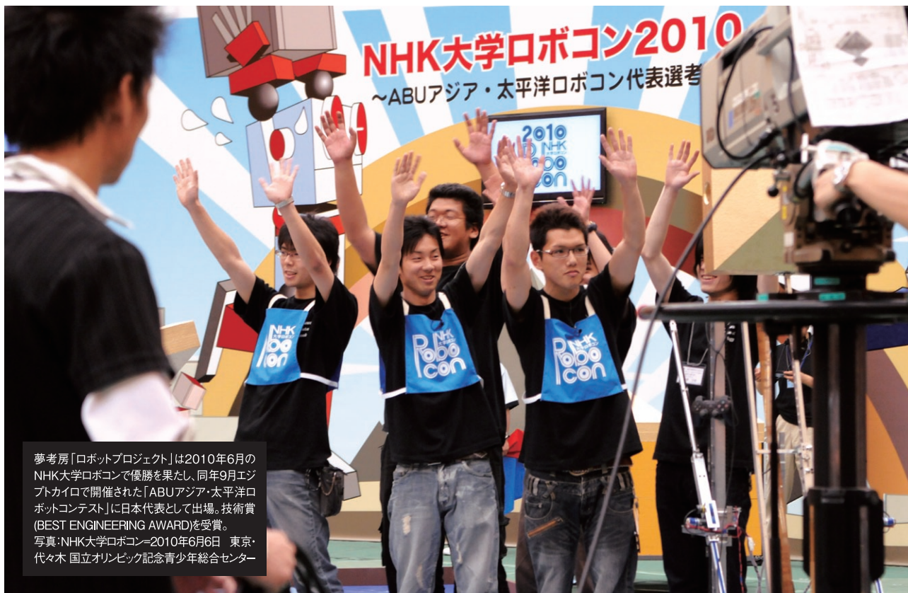
夢考房「ロボットプロジェクト」は2010年6月のNHK大学ロボコンで優勝を果たし、同年9月エジプトカイロで開催された「ABUアジア・太平洋ロボコン」に日本代表として出場。技術賞(BEST ENGINEERING AWARD)を受賞。 写真: NHK大学ロボコン=2010年6月6日 東京・代々木 国立オリンピック記念青少年総合センター