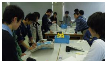
グループ・ワーク