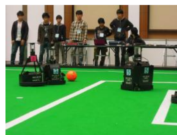
中型ロボットリーグ

車輪で動くロボットでサッカー競技を行います。最大5体のロボットを投入可能で、本学チームは5台フル出場させましたが、調整が上手くいかず、1台のみでの戦いとなってしまいました。それでも善戦し、3位となりました。