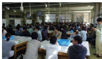
説明を聞く新生たち