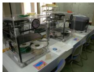
BFB 3D Touch (2台)

BFB 3D Touch 幅:230×奥行:275×高さ:210 mm ABS樹脂、PLA樹脂 Mojo 幅:127×奥行:127×高さ:127mm ABSplus樹脂