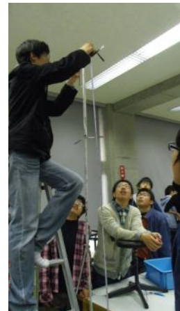
新聞紙タワーづくり