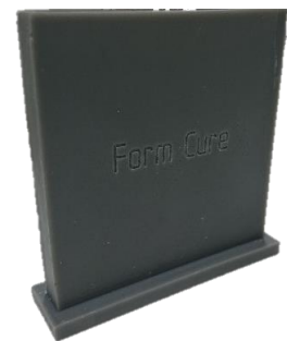
Form2・利用カード入れ