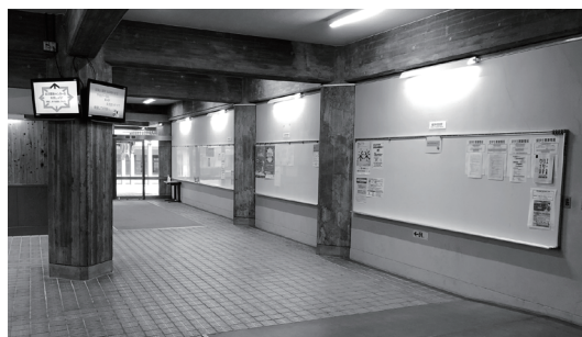
1号館 - 3号館通路の掲示板